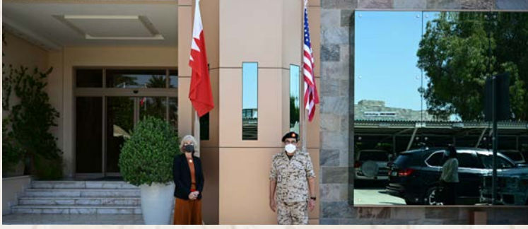
قائد الخدمات الطبية الملكية يستقبل القائم بأعمال سفارة الولايات المتحدة الأمريكية