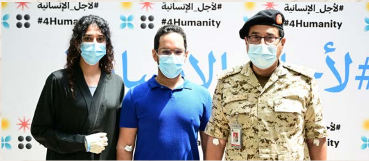
قائد الخدمات الطبية الملكية وأسرته يتطوعون في التجارب السريرية للقاح ( كوفيد - ١٩ )