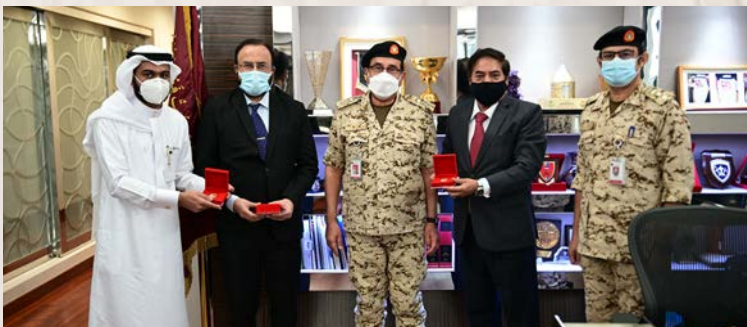
قائد الخدمات الطبية الملكية يستقبل وفد من النادي الباكستاني