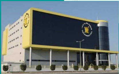
CENTRAL WAREHOUSE & DISTRIBUTION FACILITY – HIDD