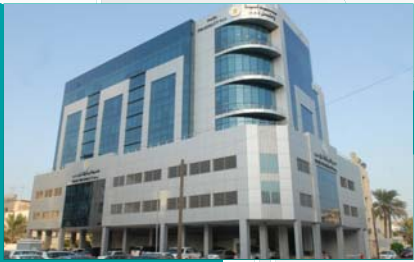
HEAD OFFICE BUILDING - MAHOOZ

Pharmaceutical products | Laboratory products Healthcare consumer products | Nutritional products | Dental products Surgical and Medical disposable products | Medical & Lab equipment