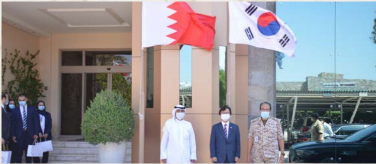
قائد الخدمات الطبية الملكية يستقبل سفير جمهورية كوريا الجنوبية