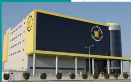
CENTRAL WAREHOUSE & DISTRIBUTION FACILITY - HIDD