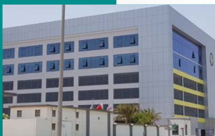
PARKING & OFFICE BUILDING - HIDD